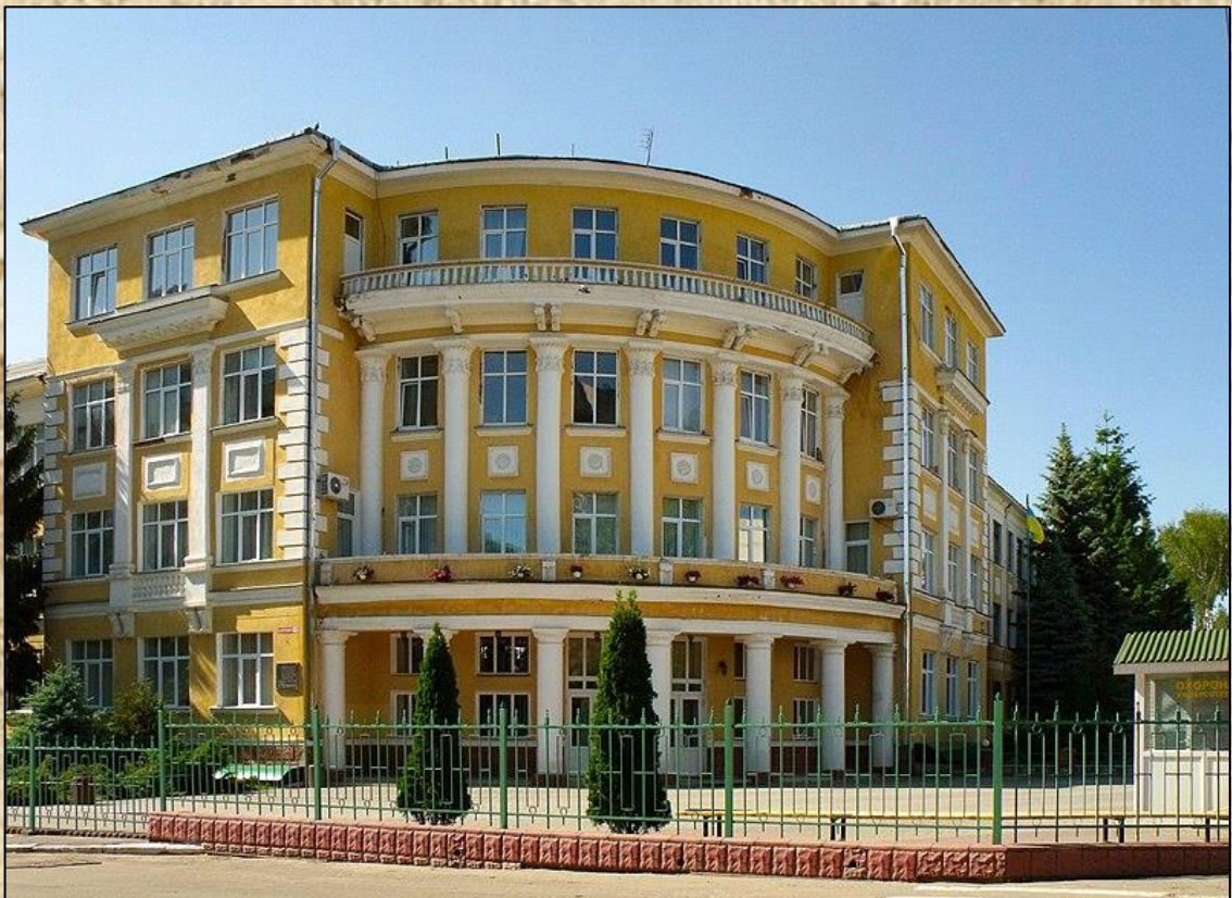
Вінницький державний педагогічний університет імені Михайла Коцюбинського