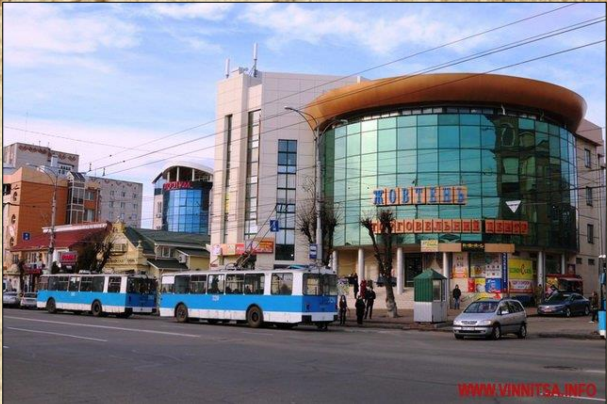
Прспект імені Михайла Коцюбинського у Вінниці