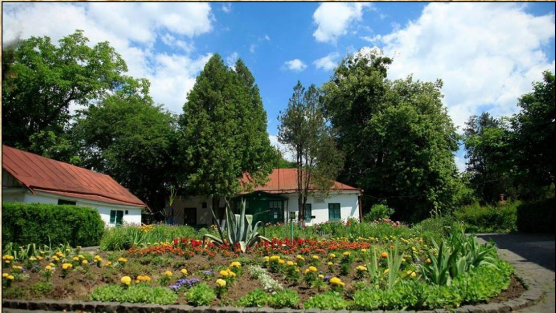
Музей-садиба Михайла Коцюбинського