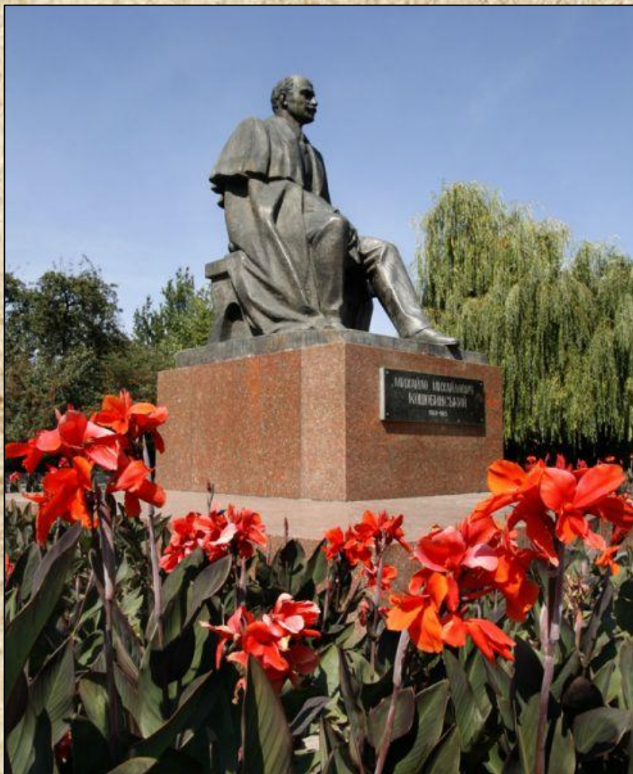
Пам'ятник відомому письменнику Михайлу Коцюбинському у Вінниці