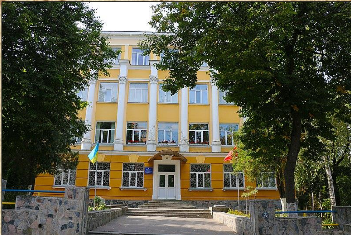
Школа № 3 імені Михайла Коцюбинського у Вінниці